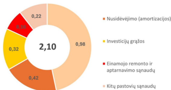
2024 m. rugpjūčio mėn. pastoviosios dedamosios dalys, ct/kWh