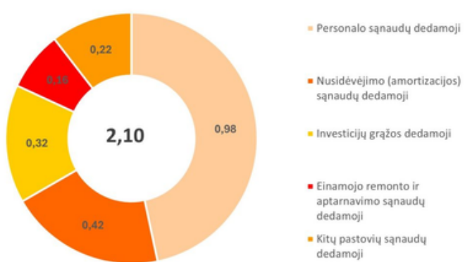
Pastoviosios šilumos kainos dedamosios struktūra, ct/kWh